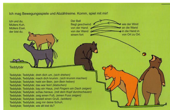
Elternbrief – 4-jährige Rückansicht (gefaltet)